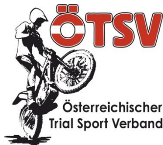
ÖTSV Trial Cup