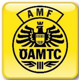
AMF ÖM TRIAL